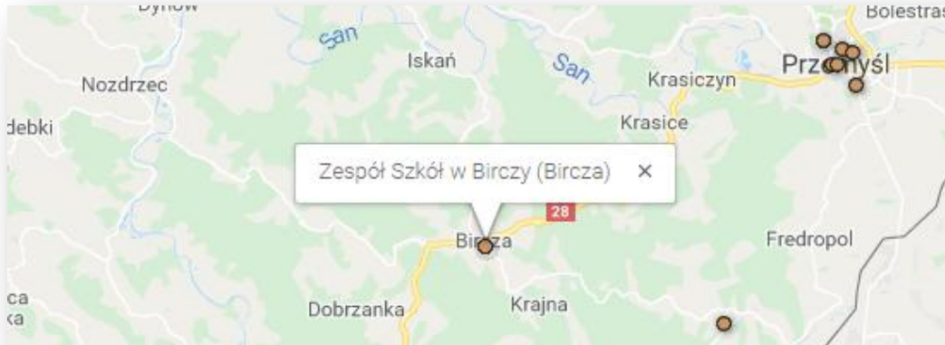
Nasza szkoła na mapie wydarzenia w regionie - rok 2018 (ze strony hourofcode.com )

W ośmiu godzinnych zajęciach on-line wykorzystujących zasoby udostępnione przez organizatorów wydarzenia uczestniczyło ok. 100 uczniów z klas IV ab, V ab i VI ab oraz (w zmniejszonym wymiarze czasowym) klasy III.